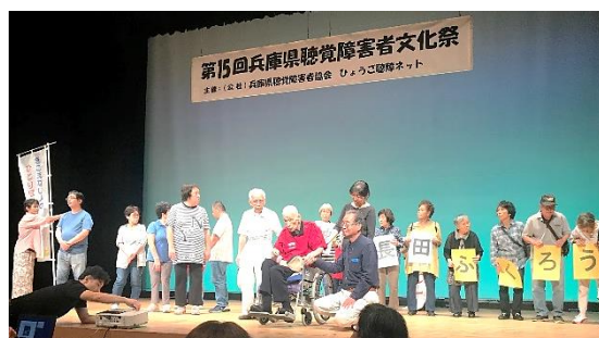
9/28 文化祭ステージで神戸ろうあハウスのみなさんが神戸長田ふくろうの杜をアピール！